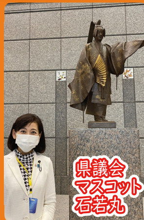
県議会 マスコット 石若丸