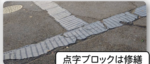
点字ブロックは修繕