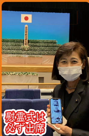
慰霊式は必ず出席