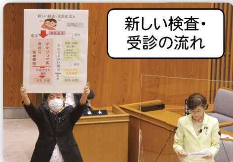
新しい検査・受診の流れ