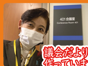
議会だよりの作りをしています