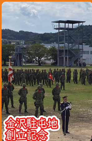
金沢駐屯地 創立記念