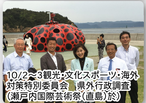
10/2～3観光・文化スポーツ・海外対策特別委員会 県外行政調査(瀬戸内国際芸術祭(直島)於)