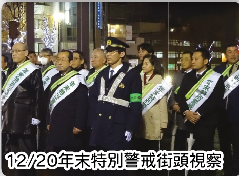
12/20年末特別警戒街頭視察