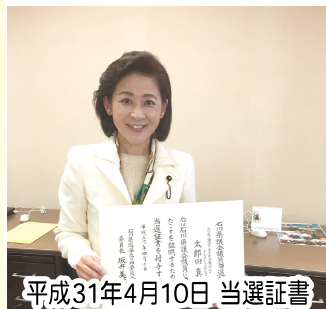
平成31年4月10日 当選証書