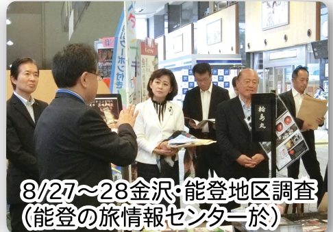
8/27～28金沢・能登地区調査(能登の旅情報センター於)