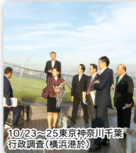
10/23～25 東京神奈川千葉 行政調査(横浜港於)