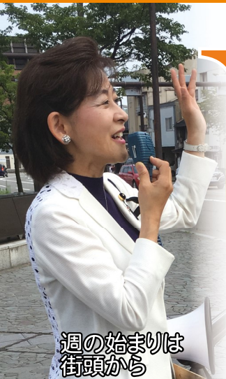
週の始まりは 街頭から