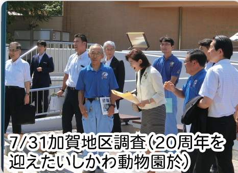
7/31加賀地区調査(20周年を迎えたいしかわ動物園於)